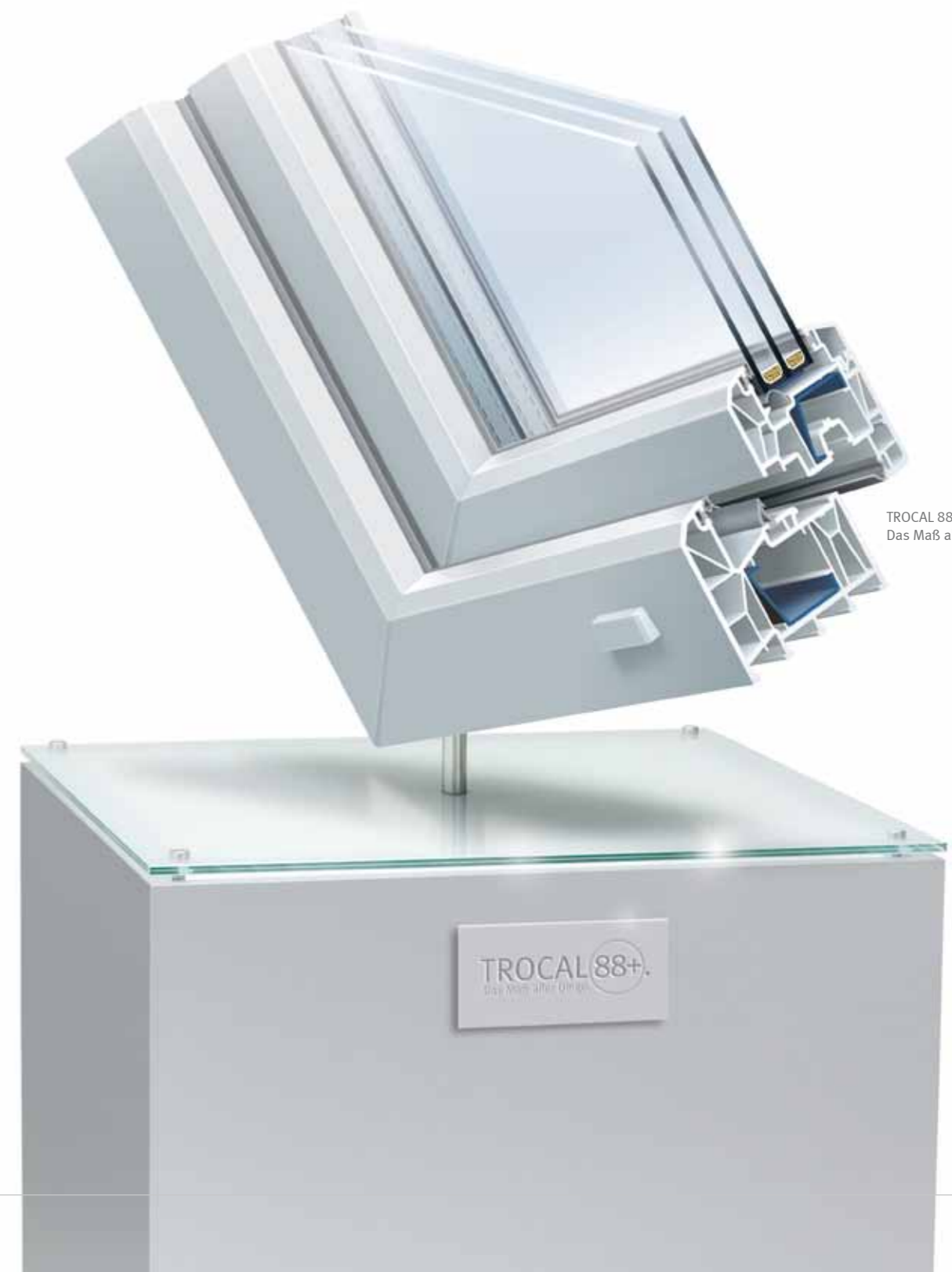
TROCAL 88+. Das Maß aller Dinge.

TROCAL 88+ ist das Maß aller Dinge für hohe Ansprüche und für eine Überlegenheit, die auch durch größere Bautiefen kaum zu übertreffen ist.